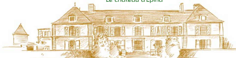
Le château d'Epina

Aujourd'hui il reste de l'abbatiale, le transept, le choeur et une petite chapelle dite « la chapelle de l'abbé ». On peut admirer le remarquable choeur de cette église abbatiale, typique de l'architecture Plantagenêt, notamment pour ses clés de voûte polychromes, et ses colonnes fines supportant des voûtes aériennes, bombées et nervurées. Deux gisants situés dans la chapelle sud rappellent ceux de Fontevraud.